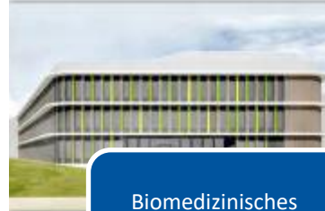
Biomedizinisches Zentrum II