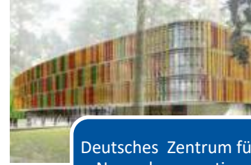
Deutsches Zentrum für Neurodegenerative Erkrankungen